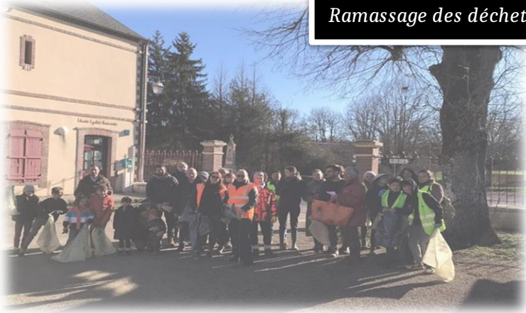
Ramassage des déchets