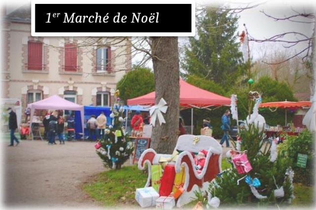
1 er Marché de Noël